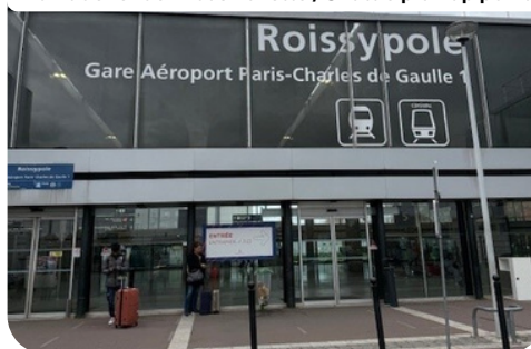
Point de rendez-vous navette / Shuttle pick-up point