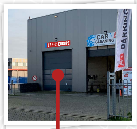
Entrée CAR-2-EUROPE CAR-2-EUROPE entrance