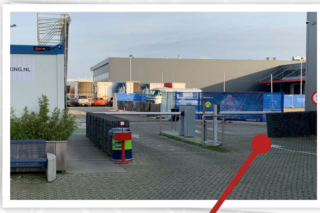
Entrée parking A4 A4 car park entrance