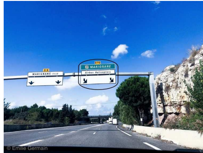
Quitter la D9 en restant sur la voie de droite et prendre direction « Marignane Aéroport » par la D20 Leave the D9 by staying in the right lane and take direction "Marignane Airport" by the D20