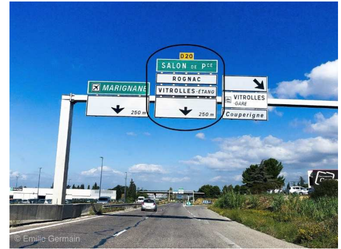
Rester sur la voie de droite, direction « Salon de Provence-Rognac » par la D20. Ne pas entrer sur le site de l'aéroport. Stay in the right lane, direction "Salon de Provence-Rognac" by the D20. Do not enter the airport site.