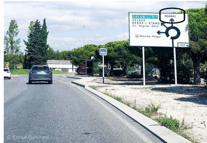
Au bout de la route à 2 voies, rester sur la voie de droite et prendre le rond-point, 2 ème sortie, direction « Rognac » At the end of the 2-lane road, stay in the right lane and take the roundabout, 2 nd exit, direction "Rognac"