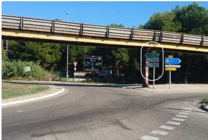
Prendre le rond-point sous la passerelle, 2 ème sortie, direction « Salon de Provence-Rognac par la D113 ». Take the roundabout under the footbridge, 2 nd exit, direction "Salon de Provence-Rognac by the D113."