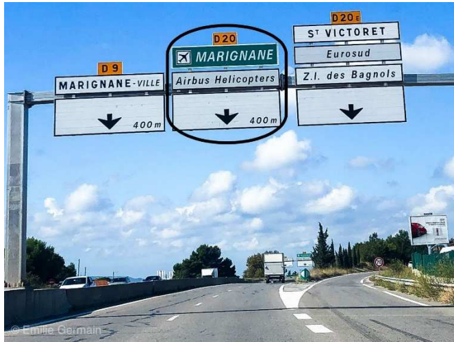
En arrivant par la D9 ou par la sortie 30 de l'autoroute A7, suivre la direction « Marignane Aéroport » Arriving by the D9 or exit 30 of the A7 motorway, follow the direction "Marignane Airport"