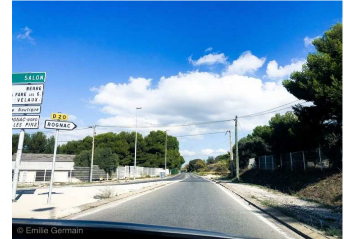
En direction de Rognac par la D20, continuer sur 500m et repérer l'entrée du parc sur la gauche signalée par l'enseigne « ALTERPARK » In direction of Rognac by D20, continue on 500 m and locate the entrance of the park on the left indicated by the sign "ALTERPARK"