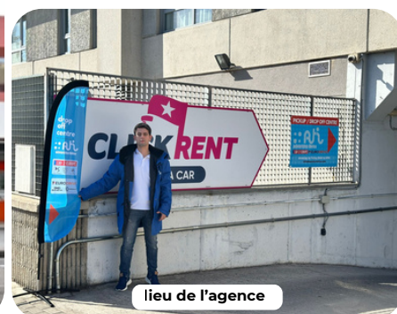
lieu de l'agence